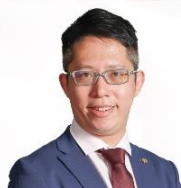
香港西區婦女福利會幼稚園

日期： 2024年3月27日（三） 時間： 下午4時30分至5時30分 地點： 2/F YCCECE Library 對象： 本校學生【主要為幼稚園準教師】 對語： 廣東話